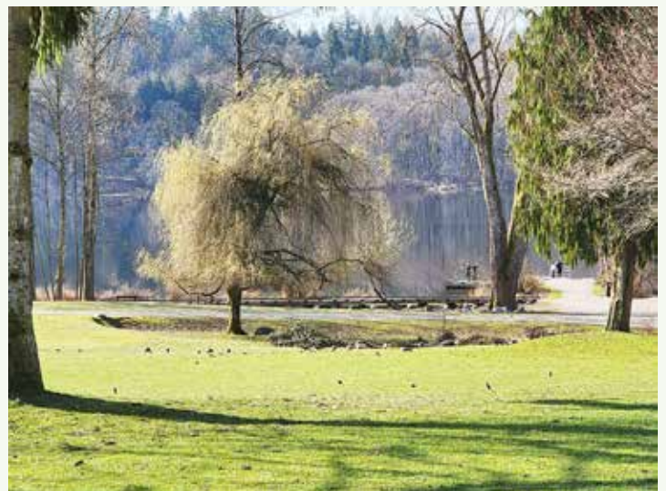
春の陽ざし Deer Lakeにて

万一成功しなければ、彼にはレースのキャリアがある。ハリウッドの大損失は、ル・マンの利益になりうるのだ。