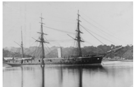
生存乗組員をトルコに送り届けた日本海軍の2隻 比叡(上)と金剛