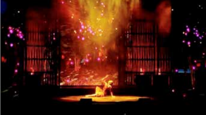
ナショナルツアーSouth Pacific Liat役ソロダンスシーン(2022年)

のモDESTでリハーサルが1か月ちょっとありました。このツアーはコロナが開けてから始まったもので、第6シーズンです。2016年にブロードウェイでキャッツがオープンし、その後ナショナルツアーに出たのですが、コロナになりました。コロナが開けて始まったのが第5シーズン。そして今回は第6シーズンということです。以前からのキャストもいれば新しい人もいます。自分は新しいキャストですから、振付を全部学んでから、去年からいるキャストと合わせてリハーサルをしました。それからオリジナルを知っているディレクターから説明を受けて、その後1週間またリハーサル。そして9月16日から今期ツアーが開始されました。