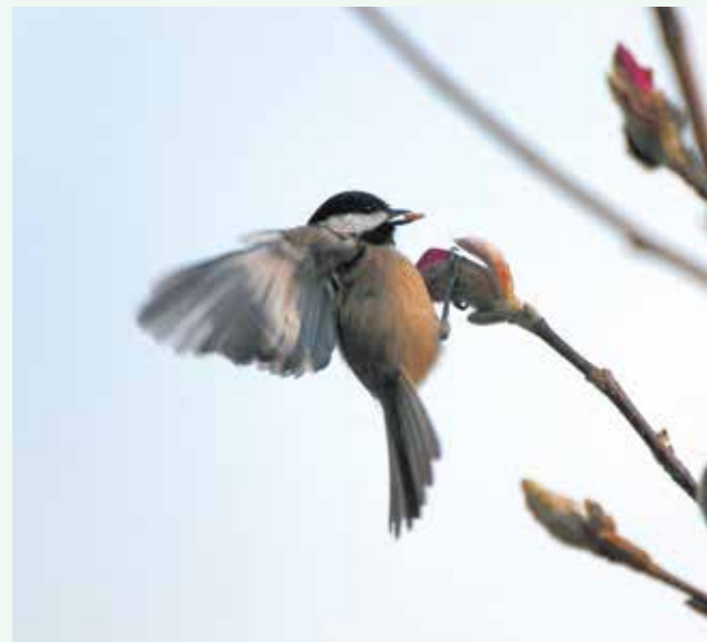
チッカディーが辛夷の花にヒマワリの種を埋め込んで連れ合いにプレゼント。