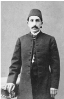
アブドゥルハミト2世

少将を団長とした一行は明治天皇に謁見し、トルコ最高勲章などの贈り物を天皇に奉呈。明治天皇