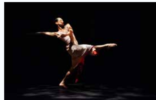
Nai-Ni Chen Dance Company 30周年公演にて