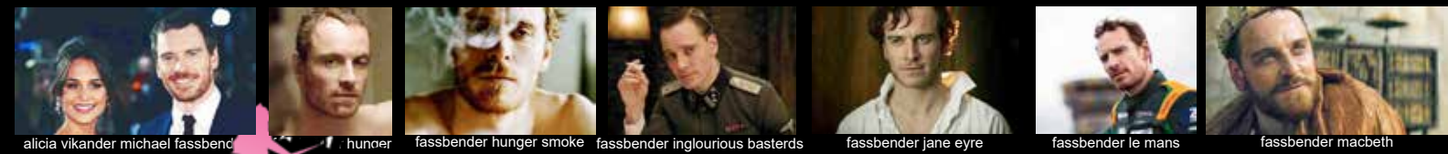
alicia vikander michael fassbender