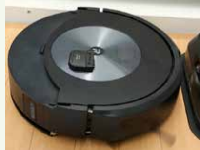
本体下部の羽根がゴミをかき集める様子が見えるロボット掃除機