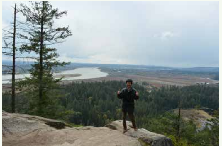
Minnehada Regional ParkのHigh Knollからの景色はよかった