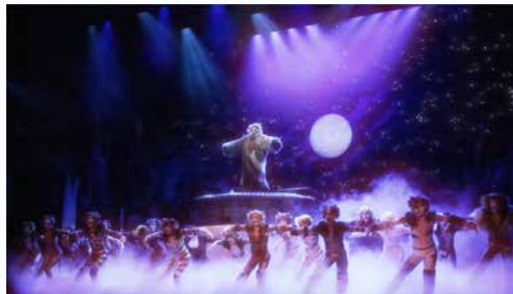
CATS National tourのショーにて

現在はBroadway CATS the musical 北米ツアー(2022-2023シーズン)で白猫ビクトリアを演じている。