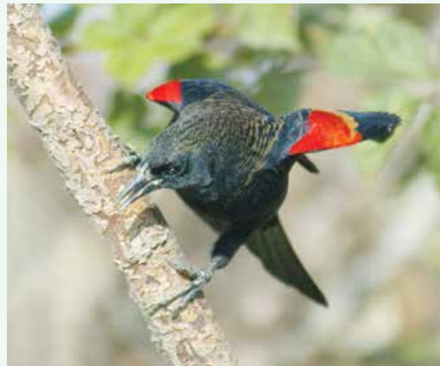
Red-winged Blackbird (ハゴロモガラス) が種を見せびらかして恋唄。