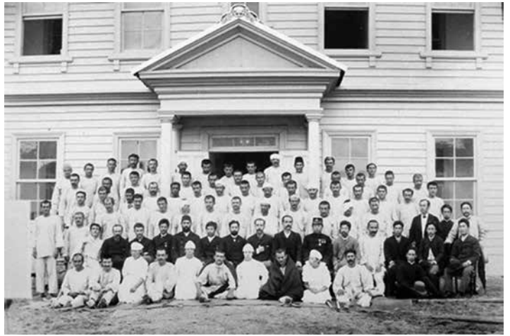
神戸救護病院にて手当てを受けた乗組員たち 着ているのは皇后陛下から賜った白衣