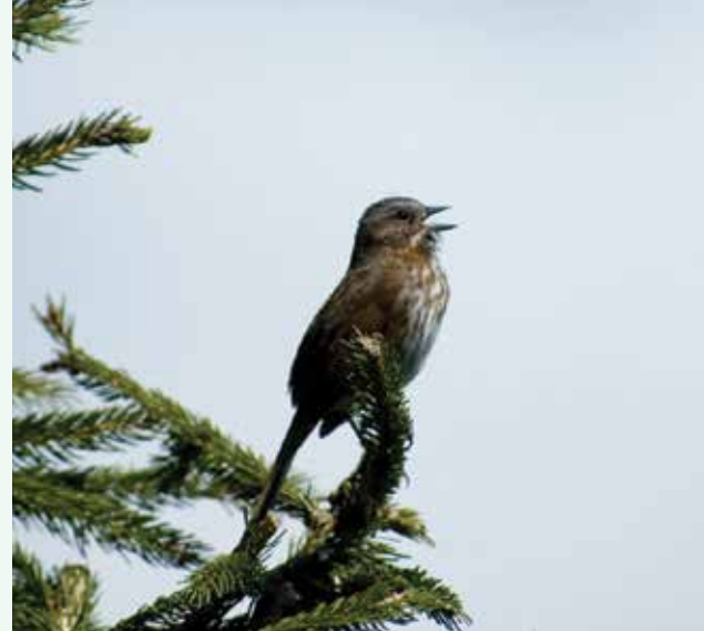
Song Sparrow (ウタズメ) はなりふり構わず唄い続ける。

掲げた写真の一枚は、オスのチカディーが花の前で舞いながら、えさ箱から取って来たヒマワリの種を辛夷(こぶし)の花の中に埋め込んでいたところだ。何をしているのだろうと見守っていると、その横の枝に止まっていたメスが飛んで来て、花の中のその種子を受け取って飛び去った。彼らは人が考えるより以上に情緒的な生き物なのだろう。