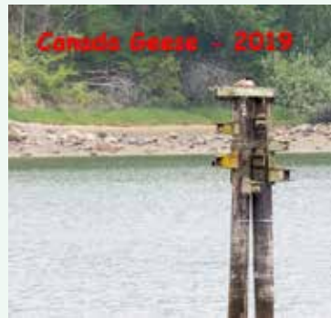
2019年、巣を横取りしたカナダ雁