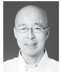
Bosley Real Estate Ltd D.H.Toko Liu

た物件在庫は過去20年でも特に低いレベルにあり、単純な需要と供給の面からも価格が押し上げられているのは明白です。