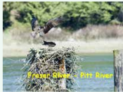
Pitt Lake湖畔のミサゴの巣