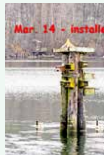
3月14日、桙(黄色の4本足の、新材で作った30センチ前後の脚)を取り付けた所