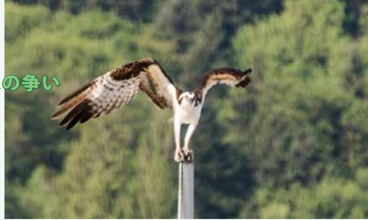
早朝の日の出とともに飛来した、巣の主が、近くの船の穂先で羽搏きました。

こうして取付けた「雁駆除」はしかし、2日目に横倒しとなっていた。それでもそこにあれば巣は作れない。カナダ雁は近くに見えない。翌日、3日目に外向くと、驚いたことに倒れ掛けていた「雁駆除」がきちんと立っていたのだ。よほど大きな船が無い限り人の手は届かない。不思議ではあったが、僕の感じでは恐らく、あの近くを徘徊していた雁の夫婦が底に上っていきりまわしたために何かの拍子で立ち上がったのかもしれない。それからまた3日ばかり経ってから調べると、今度は完全にその組子は見えなくなったが、雁の夫婦も見当たらない。雁の番いはそれ以来見えなくなり、巣造りを諦めたようだ。後は5月まで待つより他は無い。雁たちが諦めるのを願うばかりである。