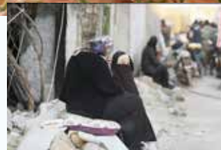
全てを失い居場所を無くした人々