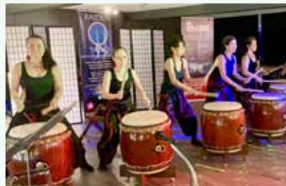
KJCAを盛り上げる太鼓グループ「Raiden Taiko」

パンデミックでの閉館中に他界した会員も多かった一方で、新たな顔ぶれを迎えているというKJCA。2023年はすべての恒例行事が再開予定で、夏には数年ぶりに姉妹都市・京都府宇治市から市長一行や中学生を迎える予定もある。