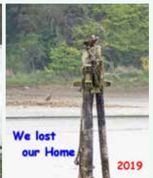
その年巣を追われたミサゴのペア