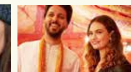
Mission Impossible: Dead Reckoning