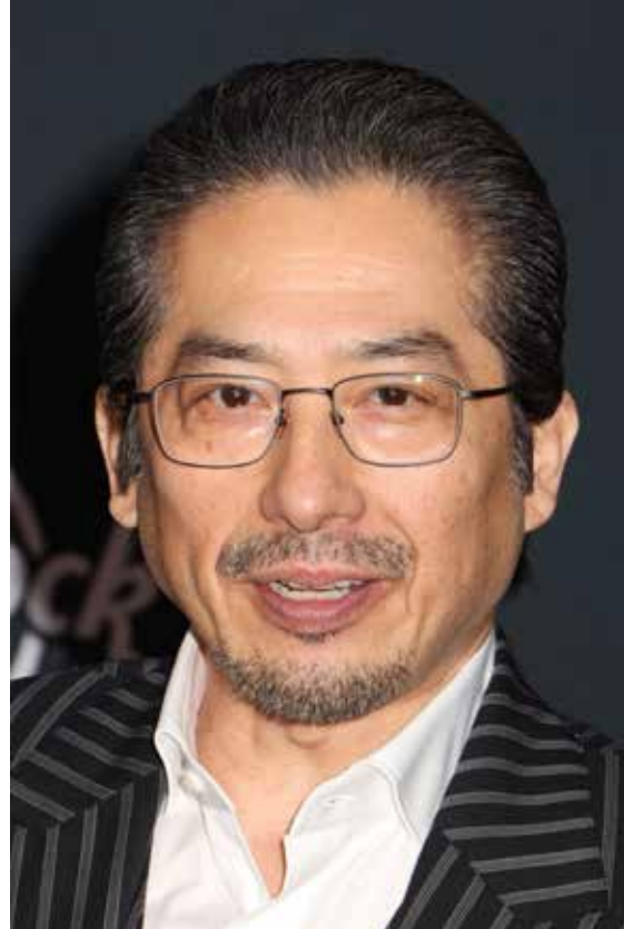
真田 広之 Hiroyuki Sanada

HS: 落ちる時は落ちるところまで落ちてしまっただけで、自分をほったらかすんです。それでほんとに落ち切ったところで、どっちの方向に這い上がればいいのか、自分の心の声を聞くといいますが、自分をごまかさず、自分の本当の奥底、心の声を聞く。そうすると、今、自分がやるべきことや、本来やりたかったことが見えてくるんです。今までの方向が違ってたとしたら、軌道修正するいい機会をもらったと思って、今、信じられるベストの方向に向かって這い上がろう、一から始めようって考えます。そして、なぜ今、このタイミングで、こういうことになったんだろうって考えます。今、