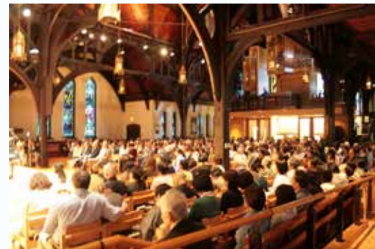
Christ Church Cathedral Vancouver 2013年のチャリティーコンサート