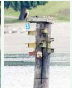
例年のようにここに巣を造るミサゴ