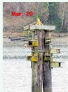
3月20日、桙の片側に寄り、斜めになっていた桙が、真ん中に立ち上がって座っていた。