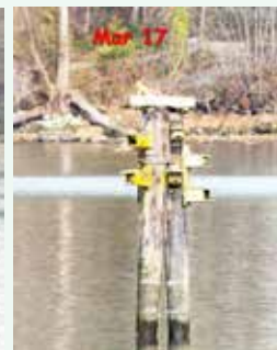
3月17日、桙が斜めになって巣棚の脇に引かれていた。