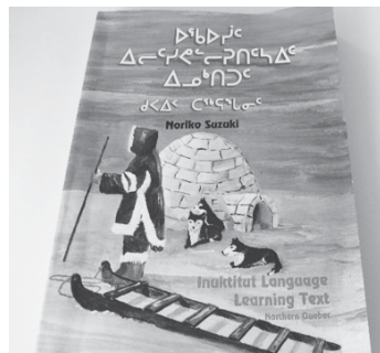
イヌイット語学習テキスト

参考までに私が手掛けた「イヌイット語学習テキスト」の写真を添付します。イヌイット語の文法、単語リスト、接辞語集、日常会話テキスト集等が内容として含まれています。1995年にノーザン・カナダ・エバンゼリカル・ミッションから出版されました。これまでのカセット・テープ4巻に替わり、現在はCD8枚付です。