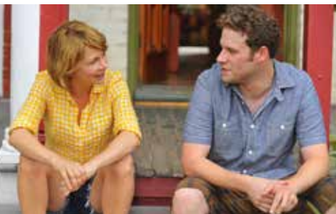
「テイク・ディス・ワルツ」