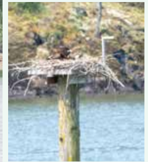
フレイザー川岸のミサゴの巣