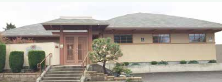
KJCAの活動拠点Japanese Canadian Cultural Centre