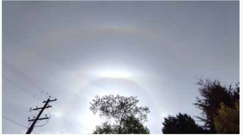
Burnabyで見た太陽の周りの暈(かさ)とその上の珍しい虹—上部ラテラルアーク 撮影日:2021年5月11日