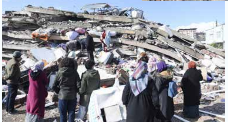
CATS National tourのショーにて