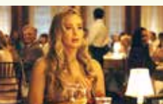
Guardians of the Galaxy Vol. 3

Challengers (8月11日) 緊迫したロマンスは、『君の名前で僕を呼んで』のルカ・グアダニーノ監督の得意分野。元プロテニス選手でコーチに転身した妻（ゼンデイヤ）とチャンピオンながらスランプに喘ぐ夫（マイク・ファイス）、そして夫のライバル選手との三角関係を描く。