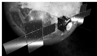
ガニメデを周回する探査機JUICEの想像図（絵：JAXA）

JUICEは欧州宇宙機関（ESA）でヨーロッパ各国が共同研究開発を行い、南米仏領ギアナの宇宙センターから打ち上げられた。