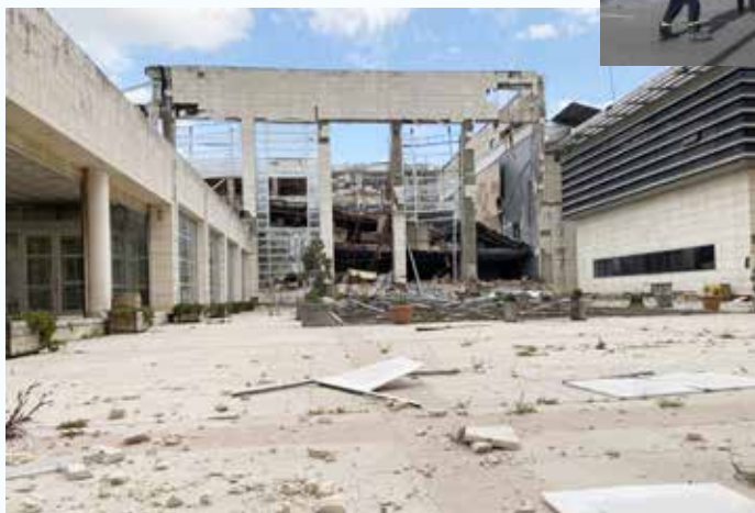
ハタイ考古学博物館 4月7日撮影

◆文化遺産保護のため、修復と専門知識を提供。4月6日、被災地テュルキエの文化遺産の修復に先立って、国連開発計画はハタイとカフラマンマラシュの考古学博物館に貯蔵品の保護のためのコンテナ計20本を届けた。