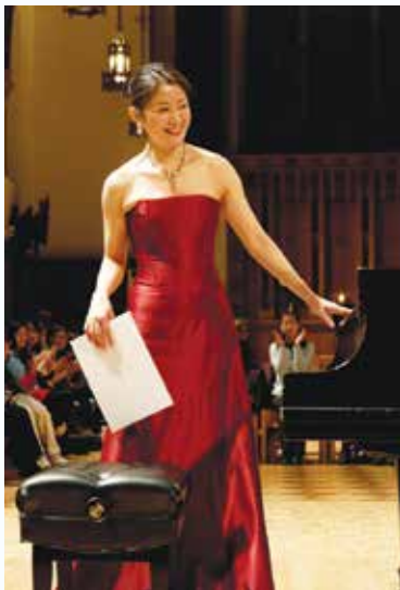
2013年のチャリティーコンサートにて

R.Y.: 1999年のデビューリサイタル以来、国内外の様々な場所で演奏をして参りましたが、毎回一つの舞台とは実に多くの人々によって創られるものだということを感じて参りました。コンサート開催に向けて何ヶ月も前から膨大な準備作業に携わる人々、当日会場に集まる人々がいてこそ、演奏者は初めて舞台上に立って演奏することができ。そして、演奏とは、様々な場所で様々な人生を生きている人々がその日その時間その場所に集まり、弾き手と聴き手が音楽を通して双方向に働きかける流動性の中から生まれてくるものだということを感じて参りました。1回1回のコンサートで心の底からあふれ出る感謝の想いを大切