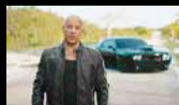
fast x (vin diesel)