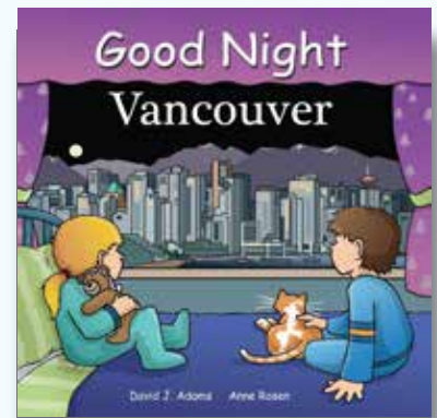
Good Night Vancouver Written by David J. Adams

Good Night Our World シリーズは多くの国や都市、職業や生き物について読みながら学べる人気の知育絵本。是非他のお話も読んでみて下さい。