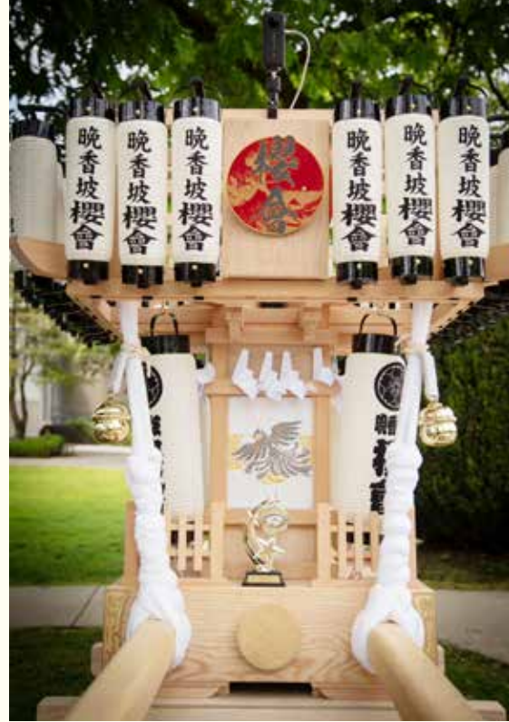
新しく誕生した 万燈神輿「感謝の神輿」

5月25日(土)、New Westminsterで行われたHyack Festivalの国際パレードがこの万燈神輿のデビューとなった。Festivalには100近