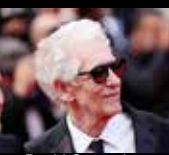
Francis Ford Coppola