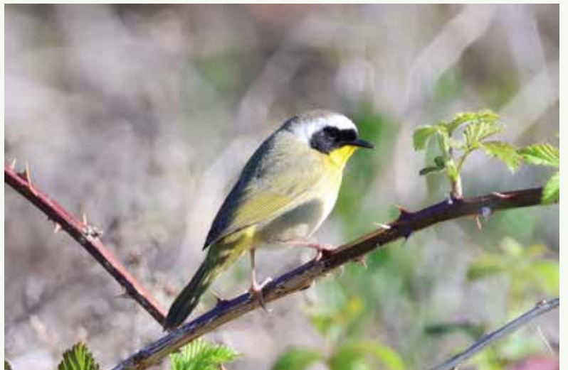
水辺で春の訪れを告げる Common Yellow-throat カオグロアメリカムシクイ

業界が人種、ジェンダー、セクシュアリティにおける包括性を向上させるための進展を遂げてきたように、年長の監督の貢献を認識し、評価することが重要だ。年配の監督たちの作品は、映画というタペストリーに豊かさと同様性を加え、映画が人間の経験の全体像を反映する媒体であることを我々に指し示している。