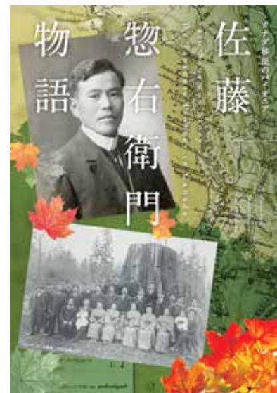
カナダ移民のバイオニア「佐藤惣右衛門物語」(2022.南北社)

呈していた。和歌山三尾周辺の人たちが毎年多数出稼ぎにやってきており、1900年頃までには3千人が住む日本人のコミュニティ、「和歌山コロニー」とでも呼べる共同体が形成されていた。