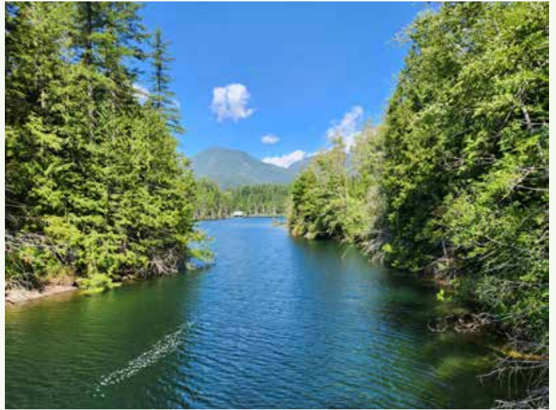
Buntzen Lake から夏のMcCombe Lakeをのぞむ