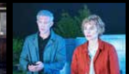
Vincent Cassel, Diane Kruger