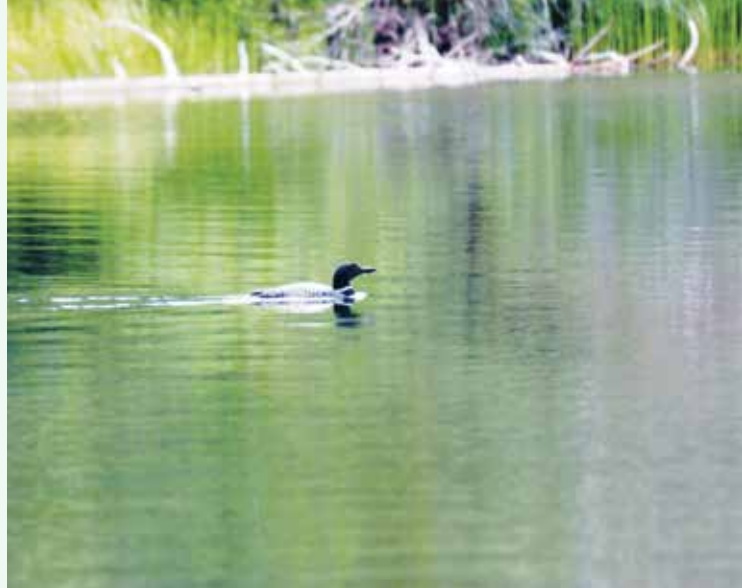
Manning Park の Lightning Lake で繁殖する Common Loon

亡き父と長兄は大の釣り好きで、7人兄弟の末っ子だった僕はいつも足手まといになりながら、小学校に入る前から付いて渡良瀬川に行ったり、高校に入る頃には毛鉤を作ることを覚え、渡良瀬川や赤城の大湖を釣り場とした。僕は餌つりの記憶は全く無く、すべて日本式の毛鉤つりだった。しかし赤城行きが病み付きとなって山登りに熱中し始め、その奥に見えた谷川岳の沢登りからはじめた本格的な登山のため、魚釣りから暫くの間縁が切れた。釣りはカナダに来て仕事も落ち着いた頃から、又頭を持ち上げ始めた。カナダに来るとすぐ週末になると子供たちを連れて近くの自然地に出かけていたので、知らない間に魚のいる川や湖を見て思い出したのだ。