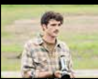
Margarethe von Trotta