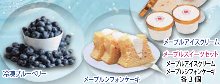
冷凍ブルーベリー