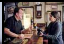
the old oak