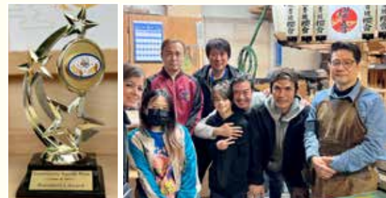
President's Award のトロフィー