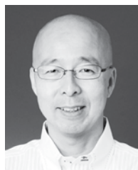
Bosley Real Estate Ltd D.H.Toko Liu

ただし現在ではそれがいつになりそうなのかを予測する事も非常に難しく、今見える傾向が世界情勢、アメリカとの関係性、中東の戦況、などの要因により流れが変わる可能性も否定できません。今後も注意深く見ていきましょう。