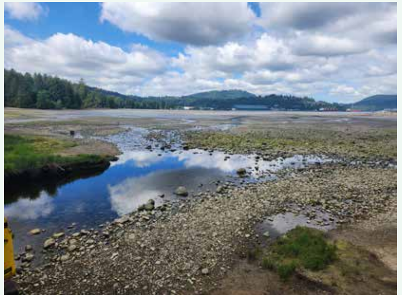
潮が引いた初夏のPort Moody Arm