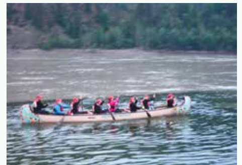
PAチームのボイジャー・カヌーが行く。

福井県出身。1999年よりユーコン在住。福祉関係の仕事をする傍ら、体力作りとカヌーのトレーニングを続ける。ライターとしての活動経験も多数。