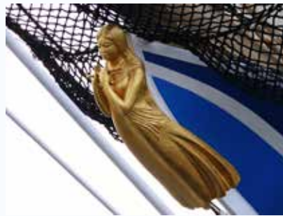
海王丸の船首像「紺青(こんじょう)」

船首像：船首に取り付けた装飾品。9～10世紀のバイキング船などから取り付けられたりしていた。16世紀以降、船の用途などによって様々な像が取り付けられるようになった。一時巨大化したが徐々に小さく軽量化していき、やがて軍艦の機能上衰退していった。