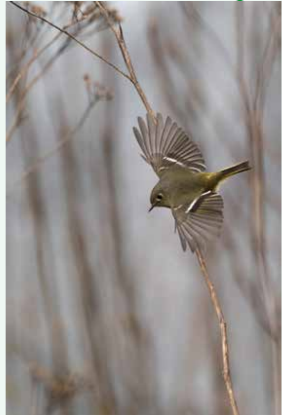
Ruby-crowned Kinglet キツラノにて