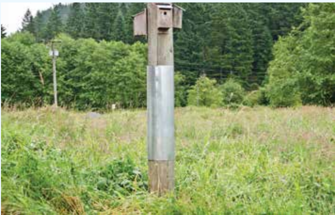
新しく取り付けられた、熊除けの無数の小穴の開いたアルミシートを既存の巣箱の柱に取り付けた

このミネカダ公園の作業がまだ終わらない間にまた事件が起こった。6月末、ピットリバー上流沿いの公園予定地で2週間毎にハミングバードのモニターに出掛けている友人から電話があり、熊がその地域に据え付けられた約40個の巣箱を襲い、殆ど全滅させたことを知らせてきた。ミネカダ公園から約10キロ離れた、深い自然地で、常時鍵の掛かった金属製のゲートを