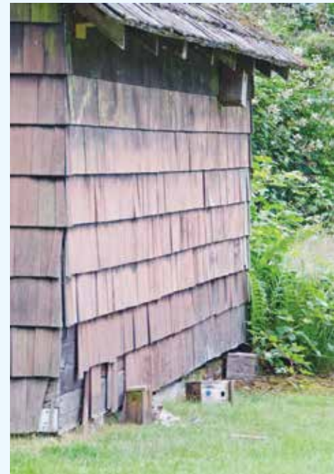
小屋の壁、7フィートに取り付けた巣箱は壊され、壁には無数の引っ掻き傷がある

では何故彼らがこの様な狩りを学習したか。その鍵は6月はじめにミネカダ公園の隣のブルーベリーファームで起こった事件だ。ブルーベリーの花が咲く頃、ミツバチの業者に依頼して蜂の巣を一時的に設置し、蜜蜂による受粉を促す。6月のはじめ、2頭の熊が電気柵を乗り越えてベリ一畑に入り込み、蜜蜂の巣箱を荒らした。蜜の味を覚えた新米の熊が、木箱の中には蜜がある事を学習して燕の巣箱を狙ったのではないかと。生き物の気配のする巣箱を壊してみると、そこには味の違う餌がいたということかも知れない。これは今の段階では予測に過ぎない。そして生きていかなくてはならない熊を僕は憎む事は出来ない。また新しい挑戦で熊除けを思案するだけである。