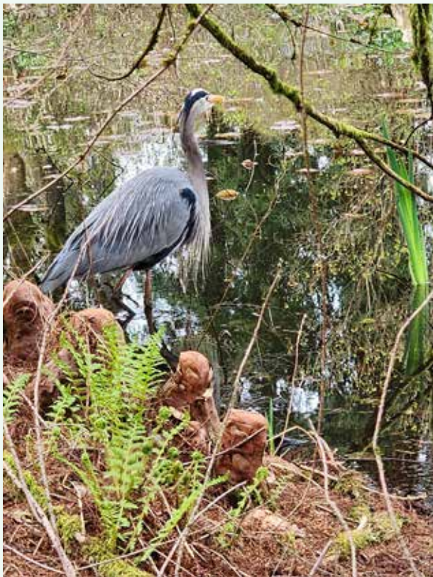
素晴らしい羽をまとった鷺! VANDUSEN GARDEN にて。