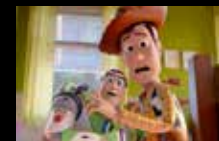
Toy Story 5