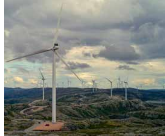
“Let Our Mountains Live”

第二次世界大戦後、アンネ・フランクが残した日記に涙して、独裁を拒否し自由の価値を共有したはずの人間社会は、一世代後には、嬉々としてカリスマ指導者や独裁者の手中に収まることを選んでしまった。「自由からの逃走」(フロム)は今も続く。