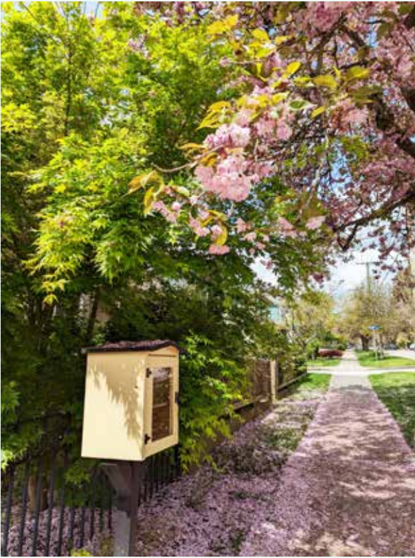
Street Libraryとピンクの道