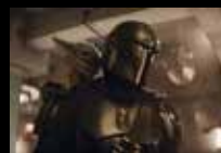
The Mandalorian and Grogu