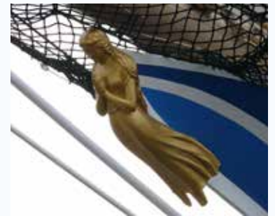
日本丸の船首像「藍青(らんじょう)」