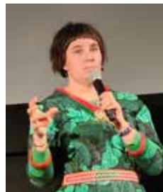
サーミ族活動家・Sissel Stormo Holtan

トナカイの遊牧を生業とするシセル・ホルタンは、法廷に立ち訴え続けてきた。ノルウェー最高裁は