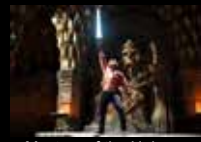
Masters of the Universe