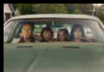
The End of Oak Street