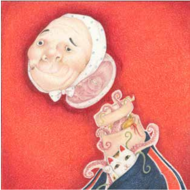
Album『take aim』 カバー写真

このalbumは以下のどれからでも聞くことができます。 https://orcd.co/xmj1ejb