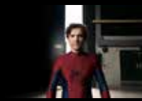
Spider-Man, Brand New Day