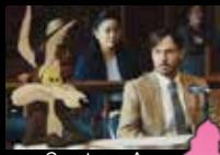
Coyote vs. Acme