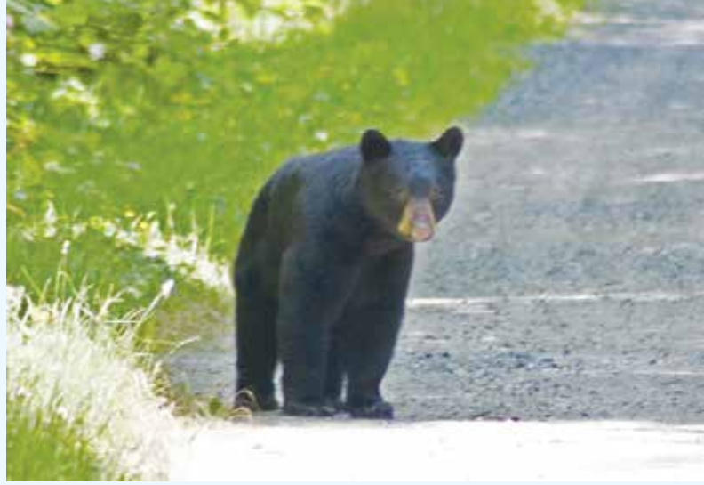
この年に親離れをした3歳児の黒熊

通って4輪駆動を走らせる1本道が公園管理人の住居に通じている。ゲートの鍵を預かっているので、早速出掛けて管理人に話を聞くと、その3日前の夕方、2頭の3歳くらいの親離れをしたばかりと思われる黒熊がやって来て、親鳥が餌を運んでいる巣箱だけ、伸び上がって引き落とし、足で潰してしまったとの事、勿論雛は全滅だった。この2頭がミネカダ公園と同じ熊かどうかは証拠が無いが、可能性は充分ある。というのはこの地域には巣箱が1994年から据え付けられていて、前記の通り、年に1~2箱以上破損されたことはなく、突然2組の熊が、その稀な破壊行為を別の地域で行う可能性は考え難い。公園予定地を走るミネカダ公園に通ずる1本道には、普段見られない多数の新しい糞が落ちていたことも考えると充分有り得る。そして、僕はそうであることを願って止まない。何故かと言うと、この種の獣の破壊行為が他の造巣地に伝播して繰り返されるのを見たくないし、普通野生動物は学習から新しい行動を身に付けると云われるからだ。熊による事件であることが判れば対策は色々あるが、それはまた別の話である。