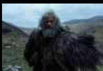
The Death of Robin Hood

そして、もしこれらの映画のうちたった1本でもそれができるのなら、それがアルゴリズムやマーケティングやあらゆる雑音を突き抜けることができるのなら、この夏は大きな意味を持つものとなるだろう。