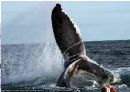
ファンディ湾で、体長40フィート(約12メートル)のザトウクジラが、75個のロブスター漁の罟とその接続ロープに絡まっていた。

カナダ政府がクジラの保護と持続可能な漁業を支援することの両方を関連付けて問題の解決のために重い腰をあげたこの計画に、動物愛護団体や研究者たちは大きな期待を寄せている。